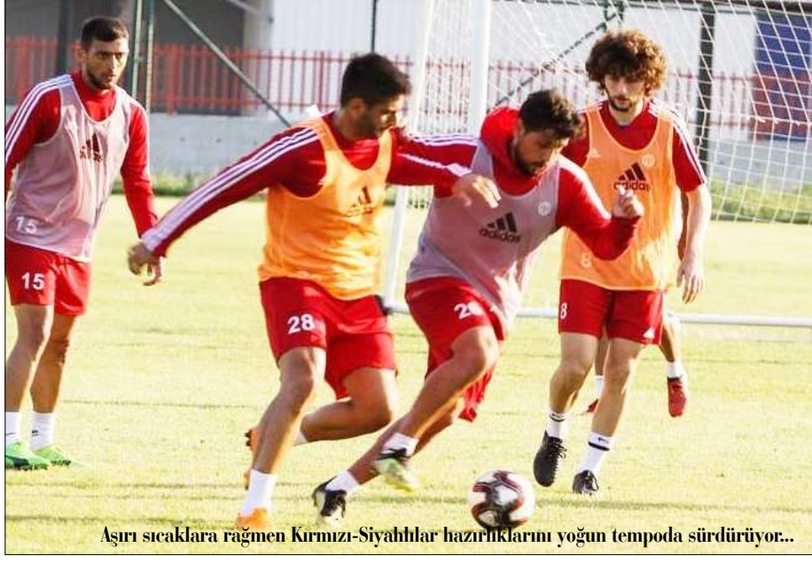
Aşırı sıcaklara rağmen Kırmızı-Siyahlılar hazırlıklarını yoğun tempoda sürdürüyor...