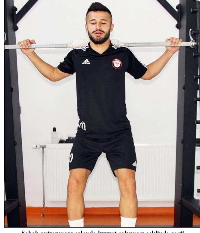
Sabah antrenmanı salonda kuvvet çalışması şeklinde geçti.

Akşam saat 17.30'da Tesisler 1 No'lu Saha'da gerçekleşen günün ikinci antrenmanı ise ısınma hareketleri ve düz koşular ile başlarken, 5'e 2 pas çalışması ile devam etti. Son bölümde yarı sahada taktik çalışma yapan Kırmızı-Siyahlılar açma germe hareketleri ile antrenmanı tamamladı.