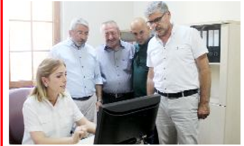
Bahçelievler Kadın Kültür- Sanat Merkezi'nde ilk tahsilat yapılırken Belediye Başkanı Halil İbrahim Aşgın, Belediye Meclisi üyeleri ve muhtarlar işlemi takip etti.