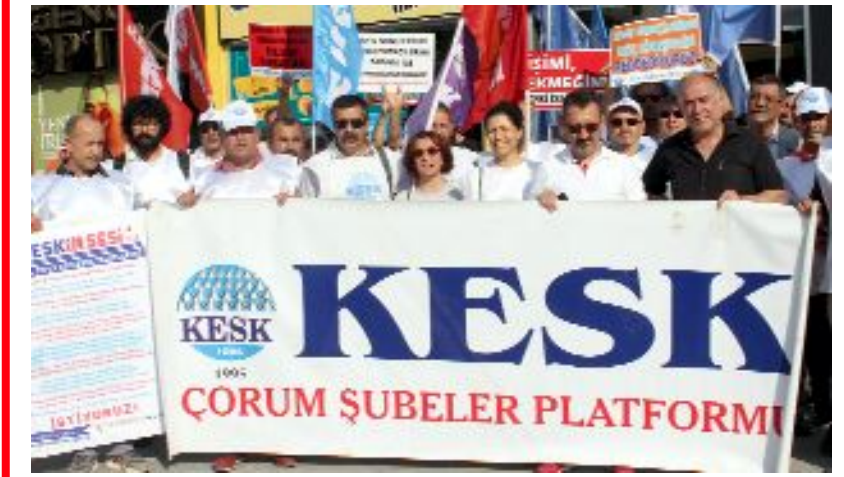
Kamu Emekçileri Sendikaları Konfederasyonu (KESK) Toplu İş Sözleşmesi görüşmeleri öncesi alanlara çıktı. Artvin'den yola çıkan yürüyüş ekibi, Çorum'da KESK'e bağlı sendikaların yöneticileri, üyeleri, emek ve demokrasi güçlerinin yönetici ve üyeleri tarafından karşılandı.